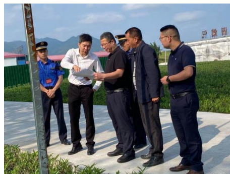
苏仕超局长到高明区开展 节前安全生产检查

为贯彻落实国家、省、市关于安全生产相关部署要求，深刻吸取近期国内多起事故教训，全面防范化解“五一”期间安全生产风险，市城管执法局高度重视，迅速开展节前安全生产督导检查，督促各区局压实安全生产责任，切实做好“五一”期间城管执法系统安全生产隐患大排查大整治工作，强化行业监管，加大监督检查力度，防范安全事故发生。