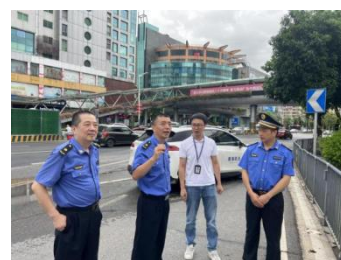
市城管执法局督导检查城管领域防风防汛工作

市城管执法局开展防台风检查，局领导分别带队到现场督查企业落实主体责任，及时消除安全隐患，切实落实防护措施。7